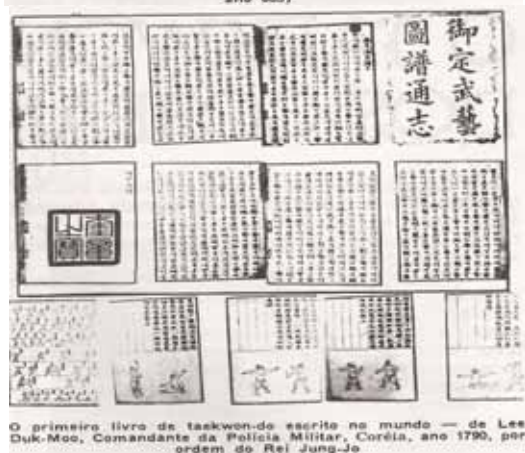
O primeiro livro de taekwon-do escrito no mundo — de Lee Duk-Moo, Comandante da Polícia Militar, Coréia, ano 1790, por ordem do Rei Jung-Jo

Algumas pessoas acreditam que o TAEKWON-DO tenha se originado do